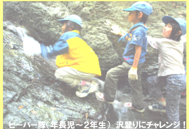
ビーバー隊(年長児～2年生) 沢登りにチャレンジ!

豊かな自然の中で楽しい仲間たちと元気にあそぶ、冒険する 森へ、山へ、川へ、海へ、仲間たちと どこへだって行ける どこでだってあそべる ハイキング、キャンプ、野外料理・・・ いろんなことにチャレンジして、最後まであきらめない心を育てよう